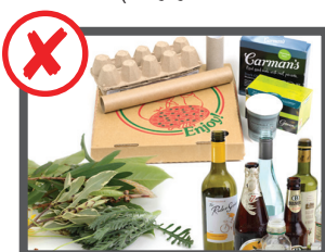
آشغال های خانگی، زباله های بازرچرخ شونده، آشغال های باغی