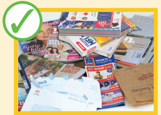
روزنامه ها، مجلات، کاغذها، پاکت نامه ها، کتاب تلفون و کاتالوگ ها