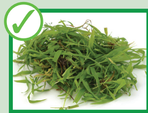
چمن و علف های برداشت شده