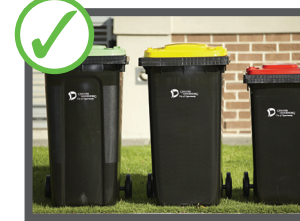
درپوش زباله دان را بسته کنید تا از ریخت و پاش و چتل کاری ممانع شود