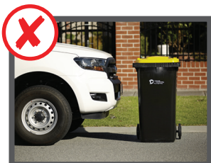
نزدیک موتور های پارک شده