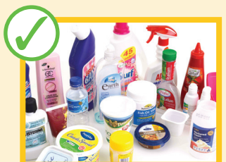
بوتل های و ظروف پلاستیکی خالی