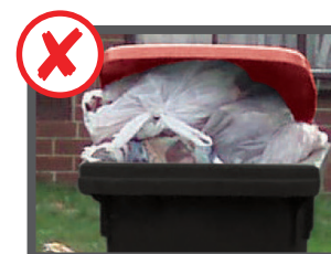
بیش از حد پر شده باشد (نتوان درپوش آن را بسته کرد)