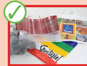
خلته ها و بسته بندی های پلاستیکی