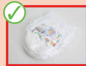
لته (دایبر- پوشک) ها (در خلته بگذارید)