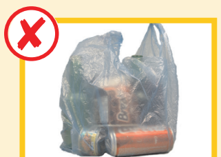
مواد بازچرخ شونده را در خلته (کیسه) نگذارید

آیا می خواهید بدانید روز جمع آوری زباله کدام است؟ از greaterdandenong.vic.gov.au/waste دیدن کرده یا به 8571 1000 تلفون کنید