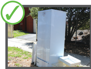
سامان های سفید آشپزخانه و فلزات

• در هر سال مالی با اطلاع تلفونی یک نوبت اشیاء زائد را رایگان می برند • حد اکثر به حجم 3 متر مکعب شماره تلفون برای معین کردن وقت: 9721 1915 اشیاء مورد قبول