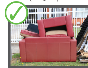
میز و چوکی و سایر اقلام