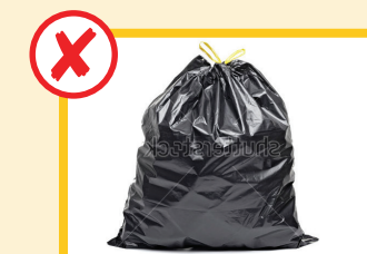
آشغال معمولی را درون بازچرخ شونده ها قرار ندهید