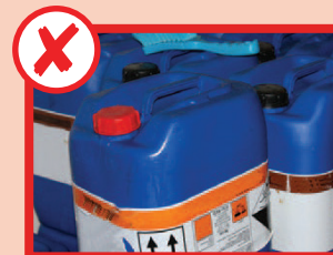
نه مواد کیمیاوی مضر