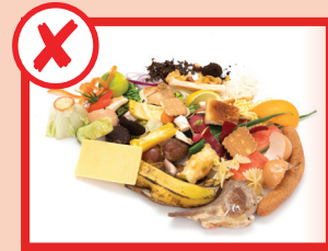
مواد خوراکی آشغال