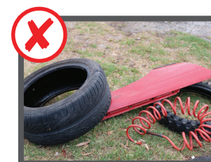
قطعات موتور، طایر، باتری، و پوسته انجین