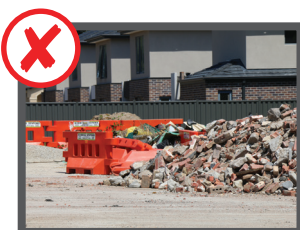
آشغال های ساختمانی و نوسازی (خشت پخته، سمنت و ازبست)