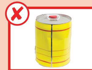
نه رنگ، روغن یا مایع