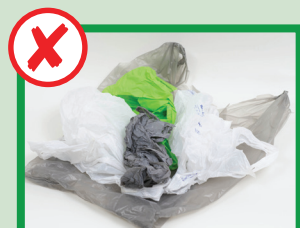
نه خلته های پلاستیکی