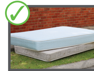
تشک (حد اکثر 2 عدد)