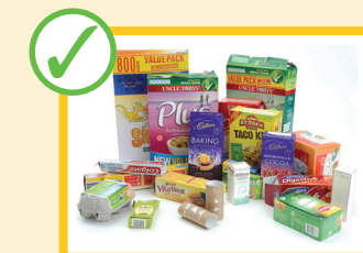
بوکس های کاغذ کاک (کارتون ها)