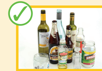
ظرف و بوتل های شیشه ای خالی