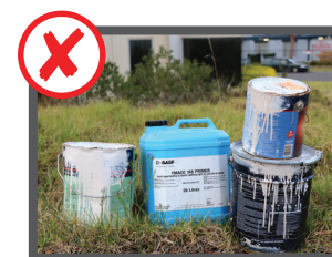
سیلندر گاز، مواد کیمیایی، مواد دفع آفات، رنگ، و مواد زائد خطرناک