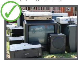
تلویزیون و کمپیوترها