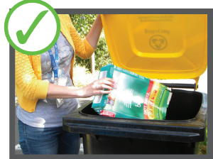
در زباله دان مخصوص بازرچرخ شونده ها اشیاء را مثل پرکنید