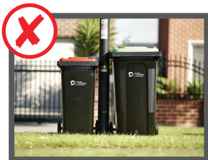
نزدیک ستون چراغ برقی