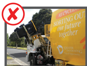
گران وزن باشد (بیش از 80 کیلو گرم)

اگر زباله دان را بر ندارند یک برجسب روی آن می زنند با این نوشته که علت چه بوده و باید این علت برطرف گردد تا در نوبت بعدی برده شود.