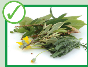
برگ درختان و شاخه های زده شده باغی