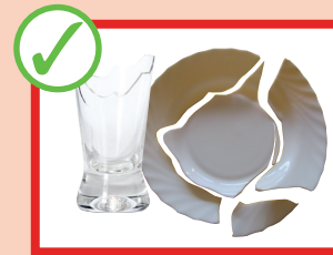
کاشی و شیشه شکسته