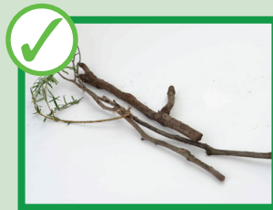
شاخه های خرد. اندازه 10 سانتی متر در 30 سانتی متر

هر دو هفته وار جمع آوری می شود اطمینان یابید که خاک با زباله های باغی همراه نباشد