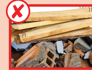
نه چوب و مواد ساختمانی