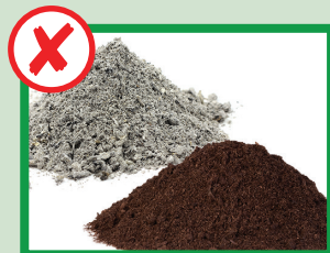
نه مواد ساختمانی، خاک یا خاکستر