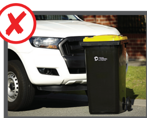
در مسیر جاده، راه، محل عبور موتور در درگاه خانه