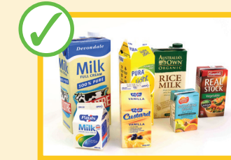
بوکس های کاغذ کاک (مقوایی) شیر و جوس (آب میوه)