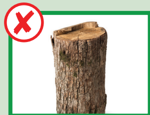
نه تنه درخت و الوار