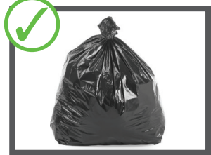
آشغال های خود را در خلته بگذارید