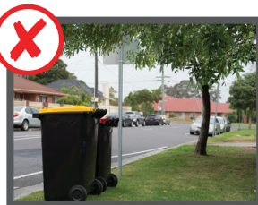
در زیر درختان و شاخه های کلان