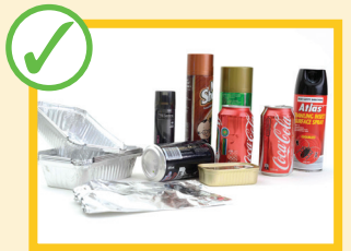
ظروف خالی و پاک بسته بندی، و قوطی های آلومینیومی، فولادی و ایروسول خالی