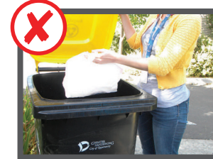
خلته های پلاستیکی را درون زباله دان بازرچرخ شونده ها نگذارید