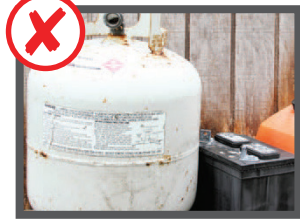
آلوده مواد غیر مجاز باشد